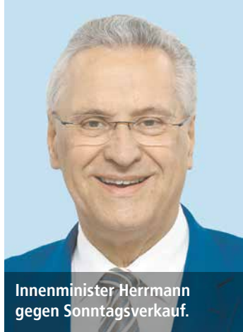
Innenminister Herrmann gegen Sonntagsverkauf.

Dem Ziel von Lebensmittel-Discountern, mit sogenannten Automaten-Supermärkten den Schutz des arbeitsfreien Sonntags zu umgehen, hat jetzt die bayerische Landesregierung einen Strich durch die Rechnung gemacht. Gegen die automatisierten Kleinstsupermärkte mit Sonntagsöffnungen hat sich die KAB gemeinsam mit der Allianz für den freien Sonntag seit Langem ausgesprochen.