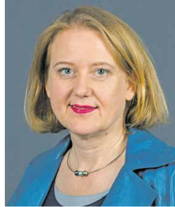
Will bis 2024 eine Kindergrundsicherung beschließen: Bundesfamilienministerin Lisa Paus.