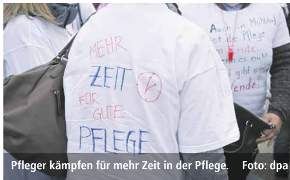
Pfleger kämpfen für mehr Zeit in der Pflege.

derzeit noch zwölf Tage und manchmal sogar mehr Dauereinsatz erlaubt. Zwar können und konnten wir betrieblich bessere Regelungen erstreiten, dafür aber müssten viele Mitarbeitervertretungen (MAV) erst ge-