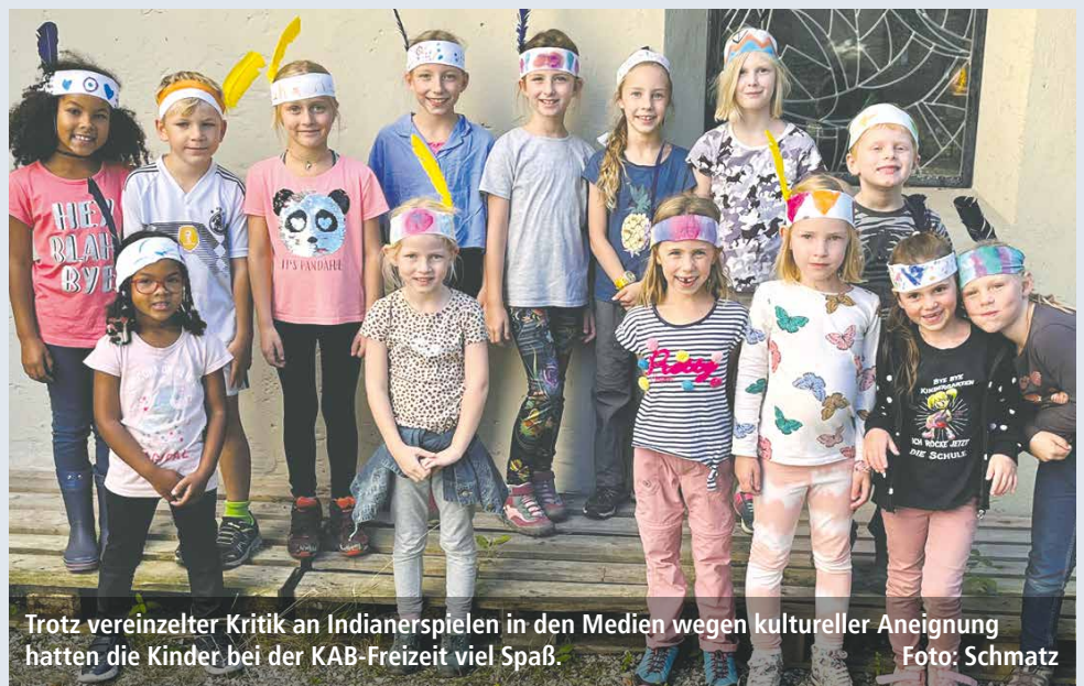
Trotz einzelner Kritik an Indianerspielen in den Medien wegen kultureller Aneignung hatten die Kinder bei der KAB-Freizeit viel Spaß.

PENZBERG. Auch in diesem Jahr fand die Kinder-Freizeit, die die KAB Penzberg regelmäßig in den Schulferien mit durchführt, große Begeisterung. Unter dem Thema „Glück-auf-Indianer“ nahmen 16 Kinder im Alter zwischen sechs und neun Jahren teil. Ziel war es, die Geschicklichkeit der Kinder anzuregen und zu fördern. Auf dem Programm stand unter anderem ein Hufeisenwerfen, das Erraten von Tierspuren und Tipi-klettern. Indianer sind gute Fährtenleser und Naturbeobachter. Am Ende fand ein gemütliches Beisammensein mit den Dorfältesten, sprich Eltern, in der Christkönigkirche statt.