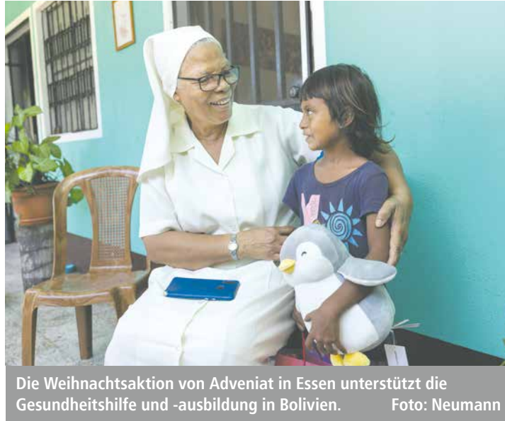
Die Weihnachtsaktion von Adveniat in Essen unterstützt die Gesundheitshilfe und -ausbildung in Bolivien.

Im Juni war die „La Esperanza“ wieder einmal bei uns. Die Krankenschwester fragte, ob es in der Gemeinde drei junge Leute gäbe, die einen Gesundheitskurs machen wollten. Dabei könnte man lernen, wie bestimmte Krankheiten verhindert werden, wie man sich gesünder ernährt, wie einfache Krankheiten geheilt und wie unsere Pflanzen zur