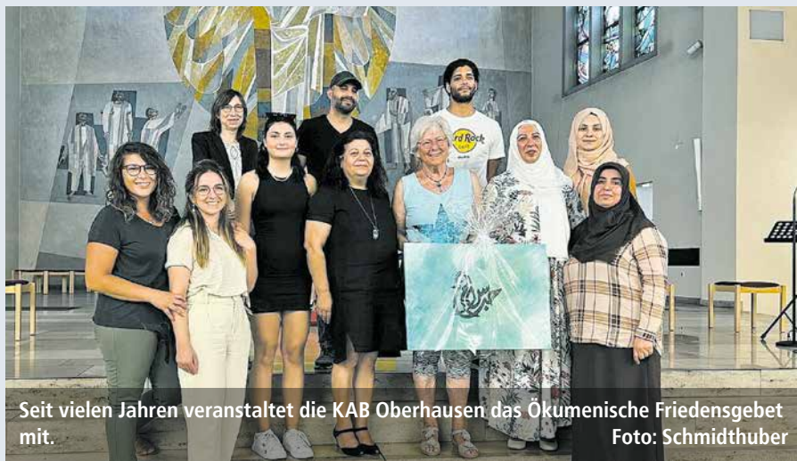
Seit vielen Jahren veranstaltet die KAB Oberhausen das Ökumenische Friedensgebet mit.