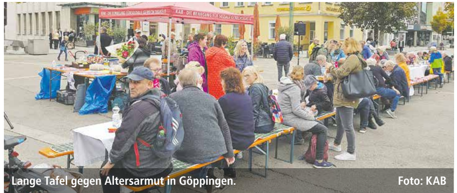
Lange Tafel gegen Altersarmut in Göppingen.

Wie ist deine Arbeit? Diese Frage hat die KAB im Bistum Würzburg mit ei-