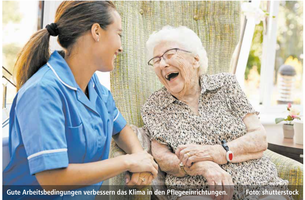
Gute Arbeitsbedingungen verbessern das Klima in den Pflegeeinrichtungen.

Pünktlich zur Halbzeit des Projekts „Gute Arbeitsbedingungen in der Pflege zur Vereinbarkeit von Pflege,