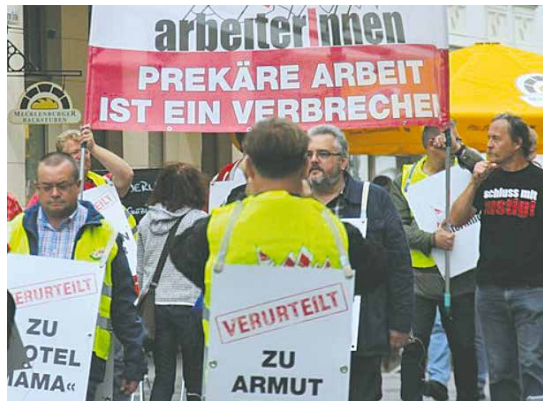
Prekäre Arbeit grenzt aus, macht krank und führt zu Armut im Alter.

ärzt*in. Abgesehen von der zunehmenden Zahl an Ärzt*innen, die teilweise jahrelang in befristeten Kettenverträgen festhängen, sind es eben auch soziale Faktoren, die prekäres Arbeiten ausmacht. Dies lässt sich daher nicht direkt vom Einkommen ableiten. Eine geforderte Dauererreichbarkeit löst z. B. eine verstärkte psychische Belastung auch in der Freizeit aus, das Abschalten von der Erwerbsarbeit wird dabei zudem durch betriebliche Gruppenchats auf dem privaten Smartphone erschwert.