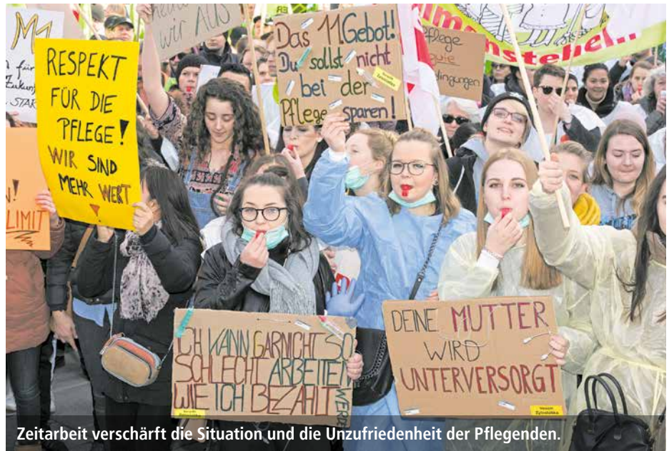
Zeitarbeit verschärft die Situation und die Unzufriedenheit der Pflegenden.

„Zeitarbeit drängt die Stammebelegschaft oftmals in die unattraktiven Rand-Arbeitszeiten, schwächt die Bezugspflege und lässt immense Beträge aus dem System der Kranken- und Pflegeversicherung abfließen, ohne dass tatsächlich zusätzliches Personal gewonnen wird“, sagte der BPA-Lan-