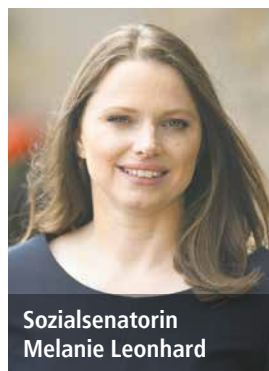
Sozialsenatorin Melanie Leonhard

Für die Hamburger Sozialsenatorin Melanie Leonhard (SPD) sollten Leiharbeiter im Sinne der Qualität und Patientensicherheit grundsätzlich nur begrenzt in Ausnahmesituationen eingesetzt werden. Pflegekräfte müssten die Abläufe und Standards in einem Krankenhaus oder einer Pflegeeinrichtung kennen und die Chance haben, eine Beziehung zu den Patienten aufzubauen.