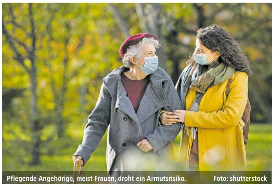
Pflegende Angehörige, meist Frauen, droht ein Armutsrisiko.

de maßgeblich mitgewirkt haben, schlägt ein Modell für eine Familienpflegezeit und ein Familienpflegegeld vor. Beide Maßnahmen sollen dazu beitragen, dass Pflege und Beruf in Zukunft besser vereinbar sind. Die BAGSO begrüßt die Empfehlungen nachdrücklich. Sie fordert seit Langem eine Pflegezeit analog zur Elternzeit sowie eine Lohnersatzleistung.