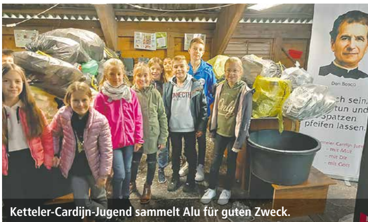
Ketteler-Cardijn-Jugend sammelt Alu für guten Zweck.

LENNESTADT. Die Ketteler-Cardijn-Jugend der KAB Olpe/Siegen hat einen ganzen Transporter voll benutzter Alu-Schalen in den Recycling-Prozess zurückgeführt. Gesammelt wurde mit Unterstützung örtlicher Gasthäuser und dem Essen auf Rädern, wo täglich diese energiereichen Schalen bei der Versorgung mit Essen anfallen. Zunächst wird das Aluminium auf seine Brauchbarkeit überprüft, von anderem Müll getrennt, in Ballen gepresst und in regelmäßigen Abständen zur Weiterverwertung in ein Aluminiumwerk gebracht. Seit einigen Jahren wird durch das Sammeln von Alu über den Verein Servir der Aufbau einer Grundschule in Pundamilia in Kenia gefördert.