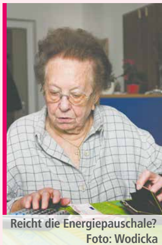
Reicht die Energiepauschale?

Die Energiepreispauschale erhält, wer am 1. September 2022 Anspruch auf eine Alters-, Erwerbsminderungs- oder Hinterbliebenenrente hat. Anspruch besteht nur bei einem Wohnsitz im Inland. Das Bundesgesundheitsministerium plant für Bewohner in Pflegeheimen, die wegen Inflation und gestiegener Energiekosten stark steigenden Eigenanteile an den Heimkosten aus ihrem Einkommen nicht mehr finanzieren können, ein Wohngeld, um sie vor der Abhängigkeit von der Sozialhilfe zu bewahren. Haben Rentner einen Minijob, können sie die Pauschale sogar zwei Mal erhalten.