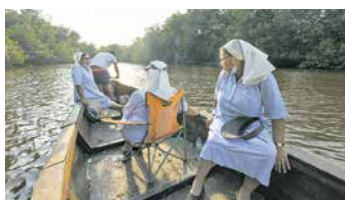
Adveniat-Hilfe am Amazonas