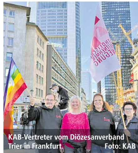
KAB-Vertreter vom Diözesanverband Trier in Frankfurt.