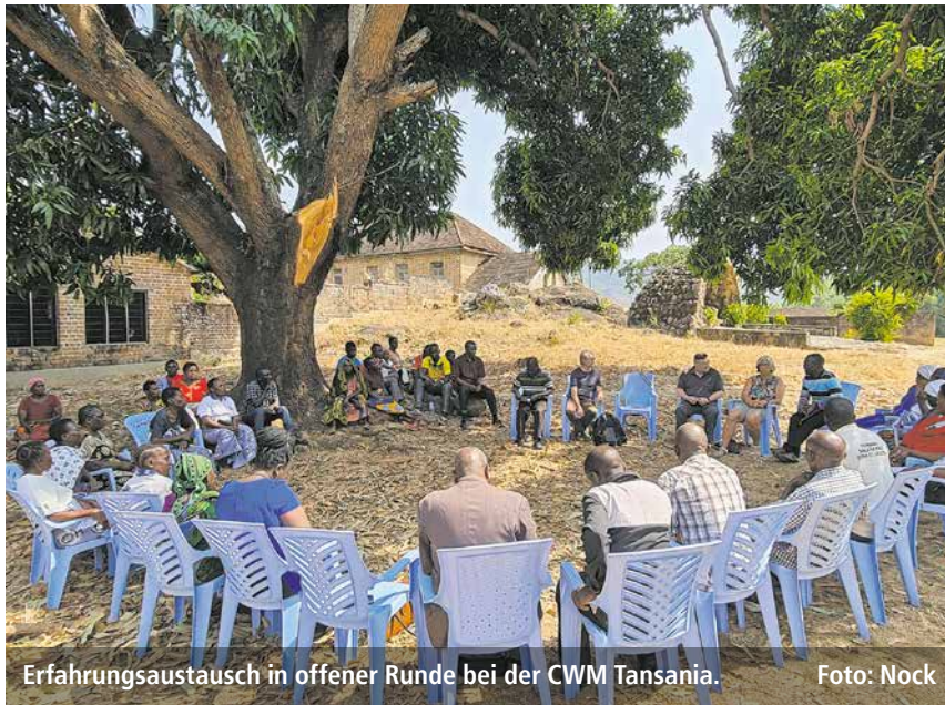
Erfahrungsaustausch in offener Runde bei der CWM Tansania.