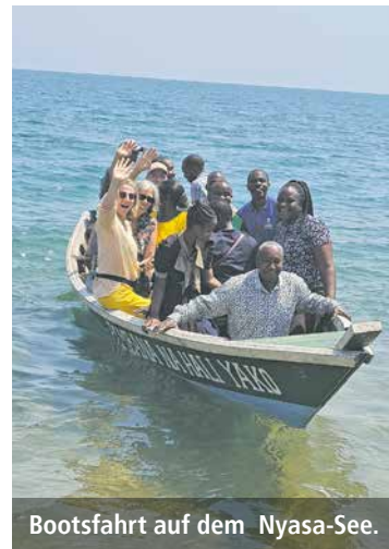
Bootsfahrt auf dem Nyasa-See.