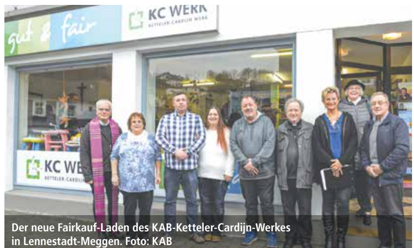
Der neue Fairkauf-Laden des KAB-Ketteler-Cardijn-Werkes in Lennestadt-Meggen.