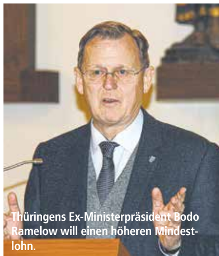
Thüringens Ex-Ministerpräsident Bodo Ramelow will einen höheren Mindestlohn.

Linke-Politiker Ramelow macht dafür das Aufweichen von rechtlichen Strukturen verantwortlich. „Über Werkverträge und Sub-Sub-Sub-Verträge wurden verheerende Arbeits- und Ausbeutungsstrukturen möglich bis hin zu sklavenähnlichen Verhältnissen“, erklärt der damalige Thüringer Ministerpräsident. Er lobte deshalb die KAB, die immer wieder mit ihrer Arbeit genau hinschaut und auf diese menschenunwürdigen Arbeits- und Lebenssituationen hinweist.