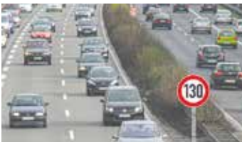
KAB tritt ein für Tempolimit ► AUS DEN DIÖZESEN Seite 18