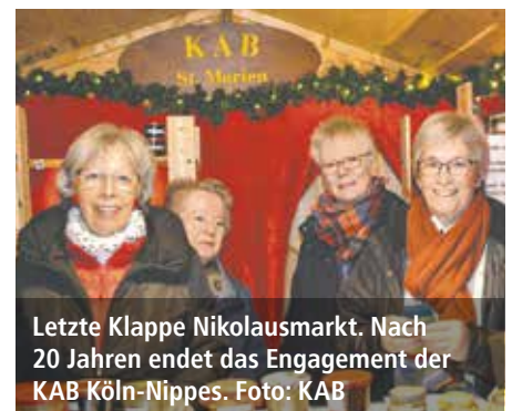
Letzte Klappe Nikolausmarkt. Nach 20 Jahren endet das Engagement der KAB Köln-Nippes.

KÖLN. Die KAB St. Marien Köln-Nippes hat zum letzten Mal am Nikolausmarkt teilgenommen. Wir haben dort seit 2009 jedes Jahr von den Mitgliedern der Nippeser KAB selbst gemachte Marmeladen, Essige und Öle, eingelegte Tomaten, Handarbeiten, Liköre, Weihnachtsdekorationen und die sehr beliebten 15-Minuten-Tüten ver-