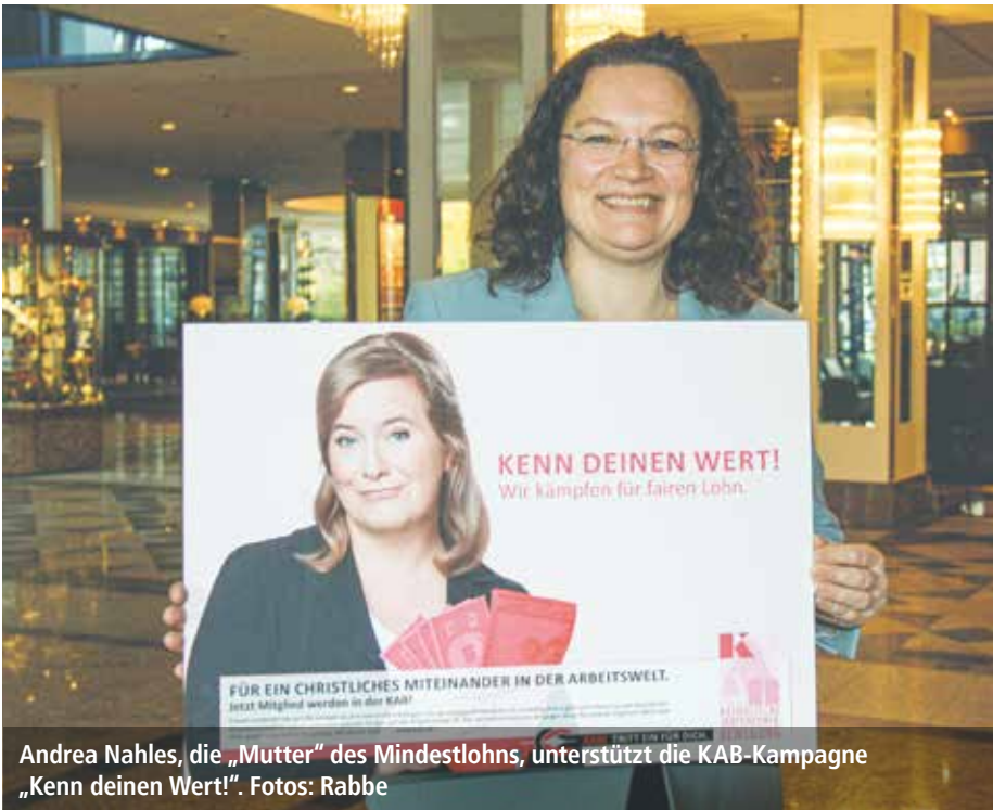
Andrea Nahles, die „Mutter“ des Mindestlohns, unterstützt die KAB-Kampagne „Kenn deinen Wert!“.

guter wirtschaftlicher Lage müssen deutsche Arbeitnehmerinnen und Arbeitnehmer mit einem Mindestlohn auskommen, der unterhalb der Armutsgrenze liegt, so die KAB Deutschlands.