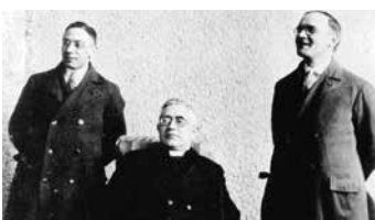
Erinnern an KAB-Widerstand ► KAB BEWEGT Seite 26