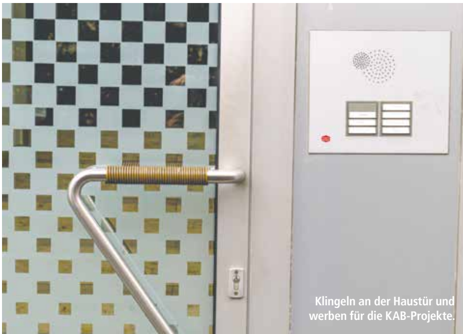
Klingeln an der Haustür und werben für die KAB-Projekte.

findet den Einsatz der KAB gut. „Natürlich, ich unterschreibe gern, wenn es hilft!“