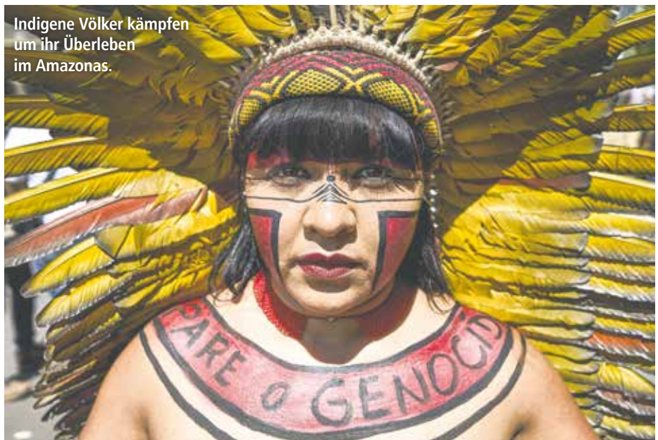
Indigene Völker kämpfen um ihr Überleben im Amazonas.