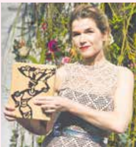
Die Schauspielerin Anke Engelke wird am 25. März die Fairtrade Awards in Berlin überreichen. Der KAB-Diözesanverband Rottenburg-Stuttgart erhält den Publikumspreis.

Mit 2130 Online-Stimmen hat die KAB Rottenburg-Stuttgart den Fairtrade Award 2020 gewonnen, der am 25. März in Berlin von der Schauspielerin Anke Engelke übergeben wird. Mit einer Petition hatte sich die KAB gegen das Handelsabkommen zwischen der EU und den ostafrikanischen Ländern ausgesprochen, da die Auswirkungen des Abkommens zu wirtschaftlicher Not und Flucht von Betroffenen in Ostafrika führen wird. Das KAB-Projekt steht als Publikumspreis bereits fest. Die Initiative der Katholischen Arbeitnehmer-Bewegung (KAB) hatte sich gegen die anderen Kandidat*innen in einem Online-Voting durchgesetzt. Der Fairtrade Award wird von der alternativen Handelsorganisation Fairtrade alle zwei Jahre vergeben und ist Deutschlands größte Auszeichnung für herausragende Akteure im fairen Handel. Die Preise werden am 25. März 2020 von TransFair an Unternehmen, Organisationen und Zivilgesellschaften verliehen.