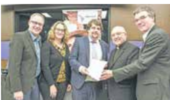
Einsatz für indigene Völker ► INTERNATIONALES Seite 25