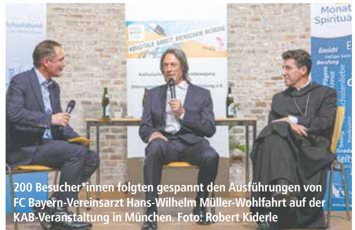
200 Besucher*innen folgten gespannt den Ausführungen von FC Bayern-Vereinsarzt Hans-Wilhelm Müller-Wohlfahrt auf der KAB-Veranstaltung in München.