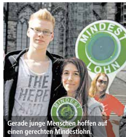
Gerade junge Menschen hoffen auf einen gerechten Mindestlohn.

Rentenversicherung ab. Was für einen Single gerade so reicht, stößt eine Familie mit einem/r Ernährer*in ins gesellschaftliche Abseits und verhindert jegliche Teilhabe.