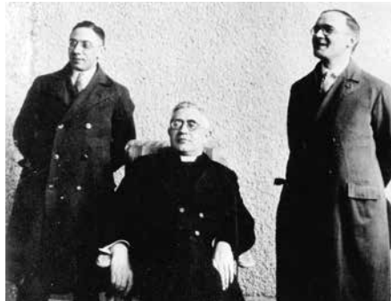
Die Widerstandskämpfer Nikolaus Groß, Otto Müller und Bernhard Letterhaus.

„Nationalistische Ideen und völkisches Gedankengut breiten sich auf dem ganzen Kontinent wieder aus und drohen, das einstige Friedensprojekt Europa von innen zu gefährden“, erklärt Overbeck im Vorwort zur 6. Auflage des Buchs „Nikolaus Groß: Christ – Arbeiterführer – Widerstandskämpfer“. Dies hatte der KAB Stadt-