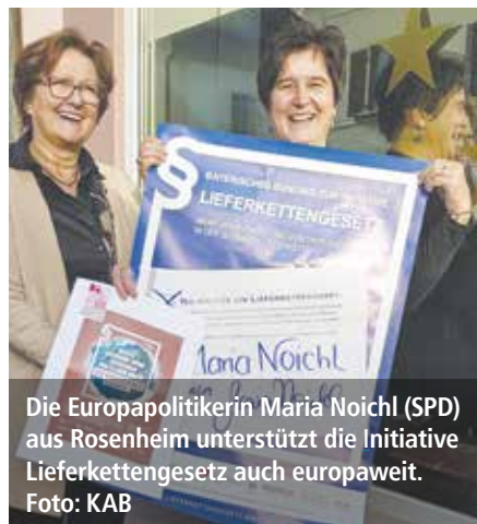
Die Europapolitikerin Maria Noichl (SPD) aus Rosenheim unterstützt die Initiative Lieferkettengesetz auch europaweit.