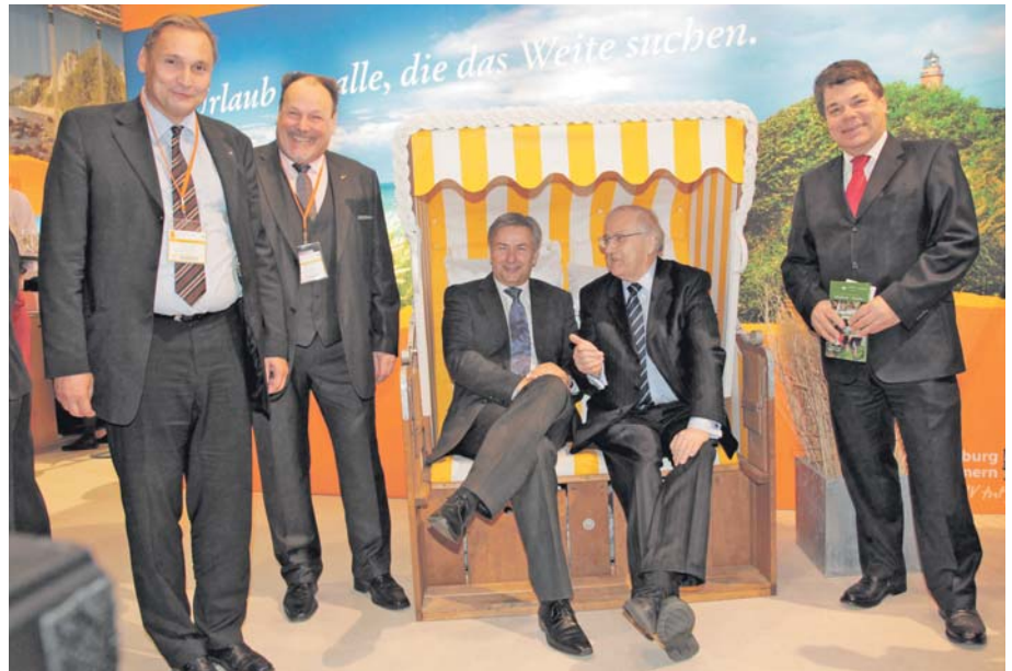
Warum in die Ferne schweifen, wenn das (die) Weite so nah ist? Bundeswirtschaftsminister Rainer Brüderle und Berlins Bürgermeister Klaus Wowereit warben auf der Internationalen Tourismus-Börse (ITB) in Berlin für einen Urlaub in Mecklenburg-Vorpommern.